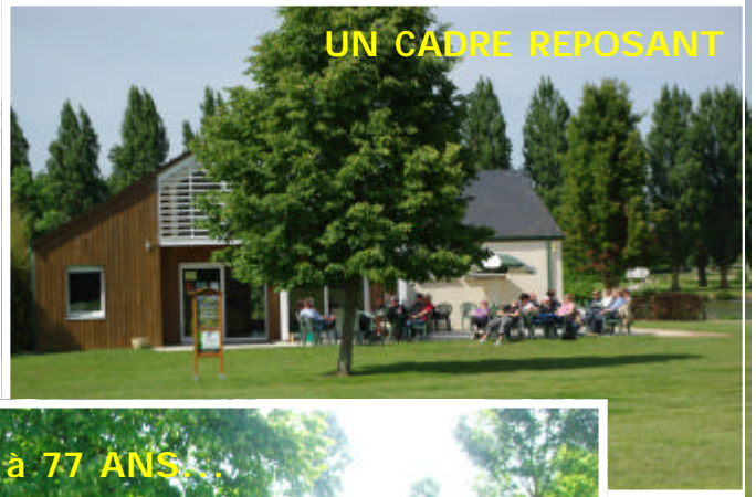
DE 7 à 77 ANS